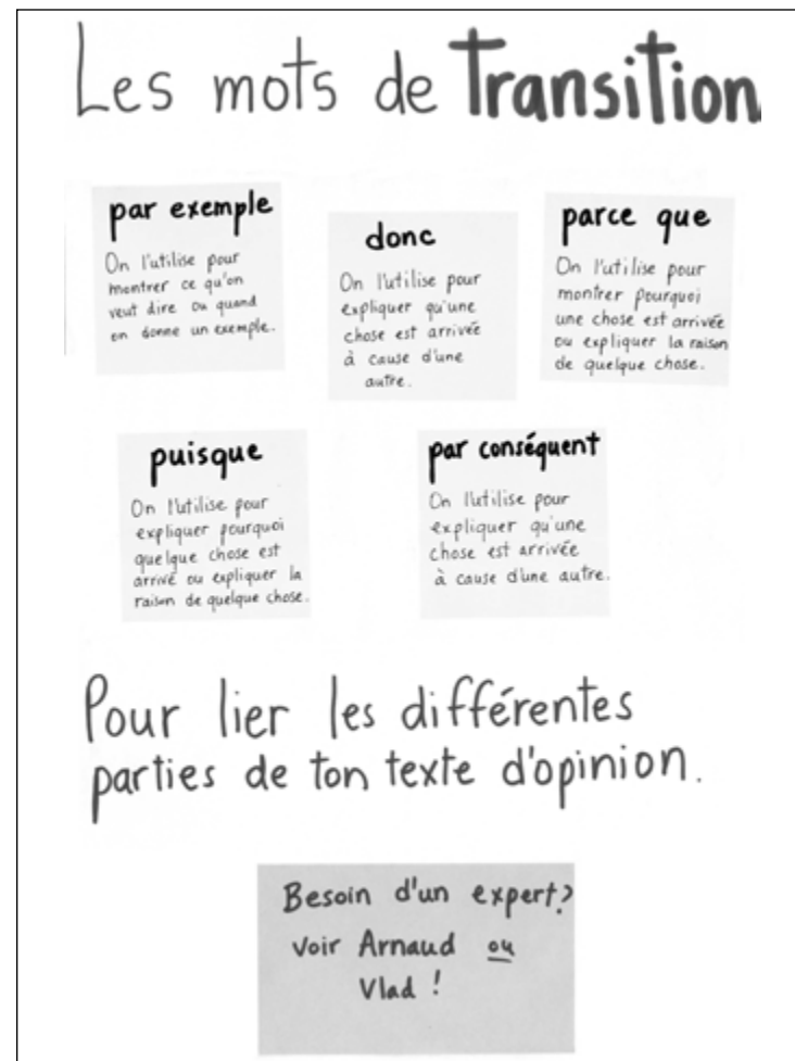
Figure 11.2 Un tableau des mots de transition. Remarquez comment cet enseignant continue de considérer ses élèves comme des experts pour valider leurs choix et aider les autres! ○

« Les auteurs, alors que vous continuez d'écrire votre ébauche et commencez à réviser votre texte, demandez-vous si chaque partie est liée aux autres. Utiliser des mots de transition est une manière d'y arriver. »